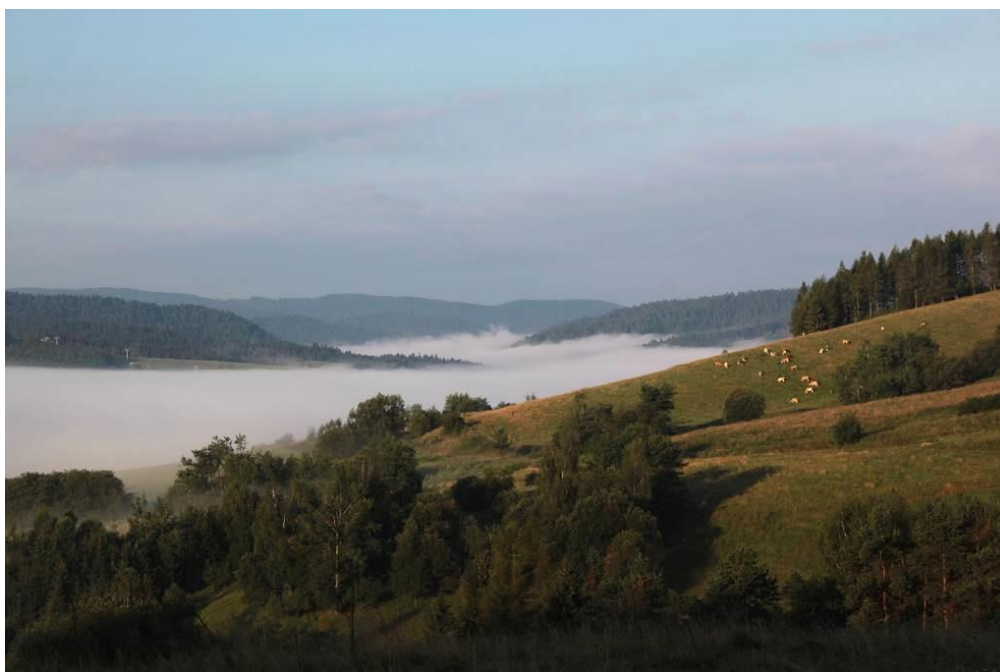
Dolina Tylicza

Adres korespondencyjny: poczta@rescarpathica.pl