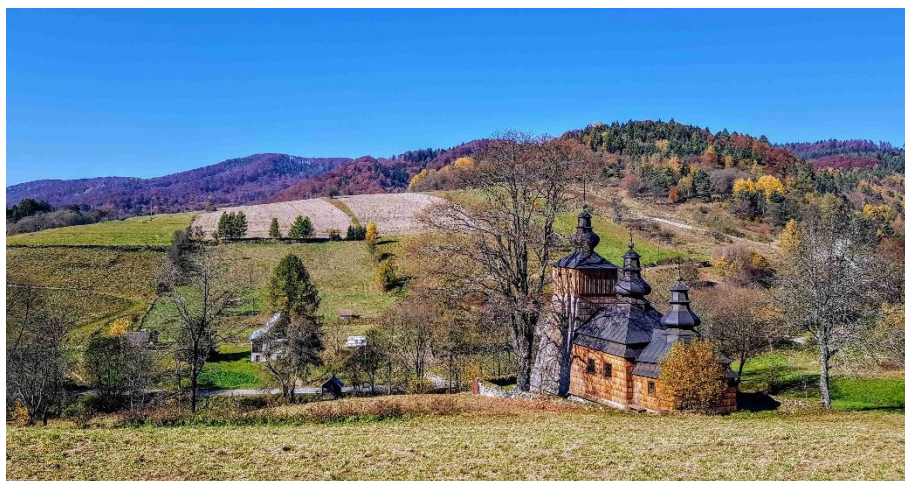
Dubne, (propozycja na konkurs „Karpacki rok 2018”)