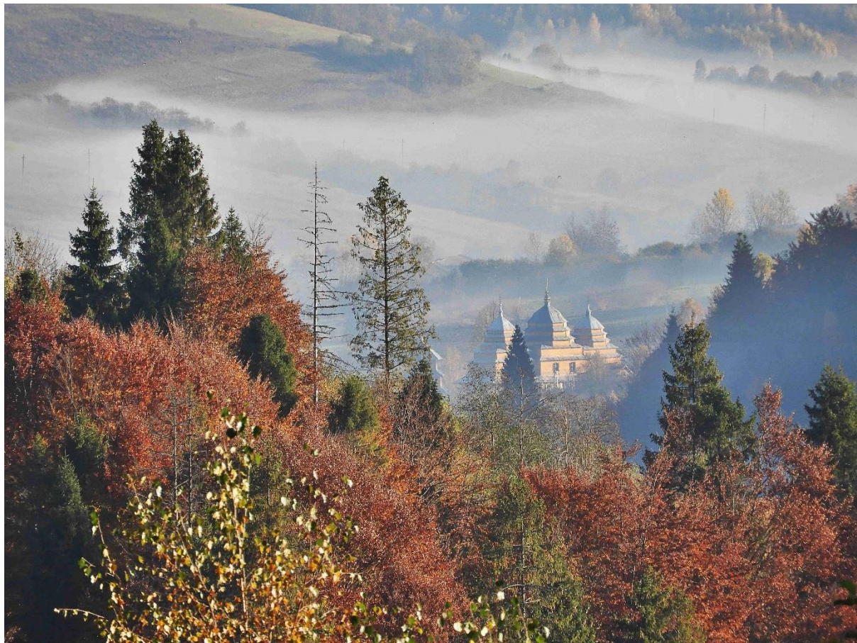
Husne Wyżne – cerkiew w jesiennych mgłach, fot. Rafał Krzyżanowski:

Podobnie jak w latach poprzednich, w pierwszych dniach stycznia został ogłoszony konkurs fotograficzny „Karpacki rok 2018” na stałych zasadach. Do 31 stycznia były zbierane fotografie, z których wybrane najlepsze prace poddano głosowaniu na naszej stronie na facebooku. Wygrała fotografia Rafała Krzyżanowskiego z Mysłowic „Husne Wyżne – cerkiew w jesiennych mgłach”. Nagrodą jest album fotograficzny autorstwa Krzysztofa Hejke.